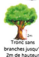
Tronc sans branches jusqu'à 2m de hauteur