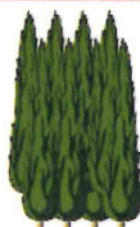
Haies éloignées de la maison

Rien en surplomb du toit et de la charpente